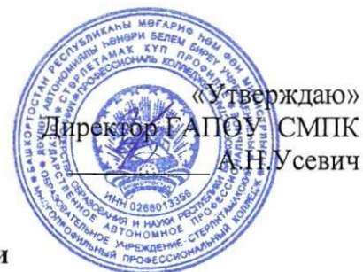
График промежуточной аттестации группы Р-21 специальности 42.02.01 Реклама